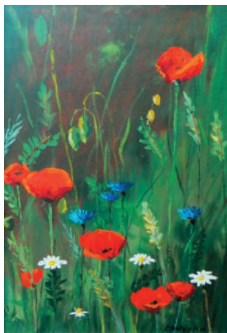
Kovács Mátyás: Pipacscsalád