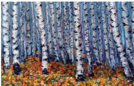
Hangyássy Jánosné: Ősz a nyírfásban