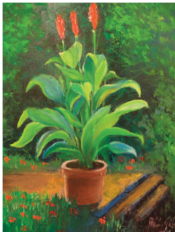
Révész Gábor: Czabai cserepes