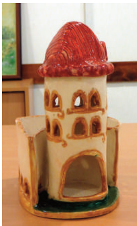
Révészné B. Jolán: Templom kerttel