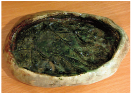
Vaád Éva: Raku kerámiák