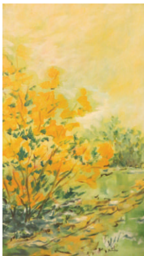
Tarnócziné Barabás Irén: Tavas