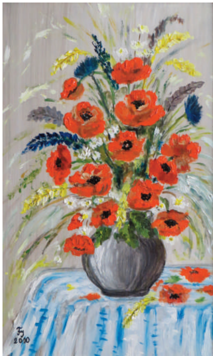
Fekete Ignácné: Mezei csokor