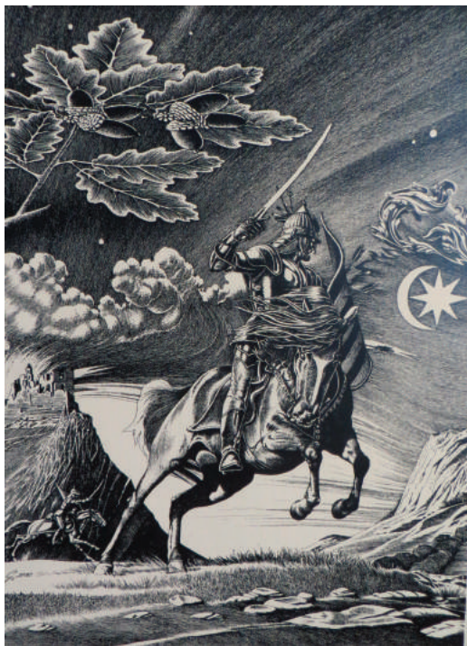
Mosonyi Kiss Gusztáv: Tollrajz