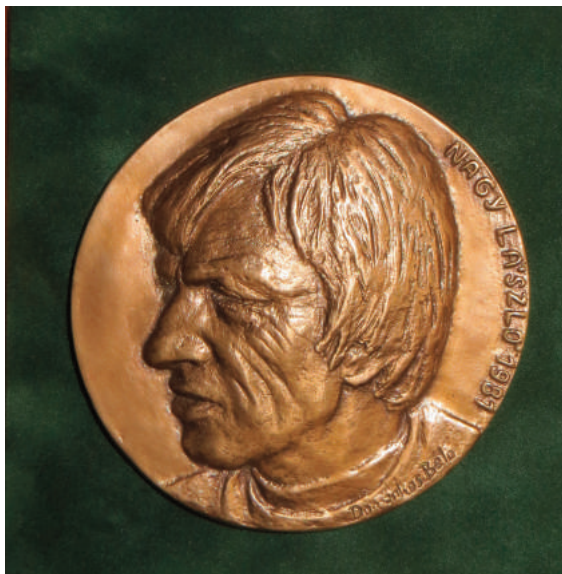
Domonkos Béla: Nagy László